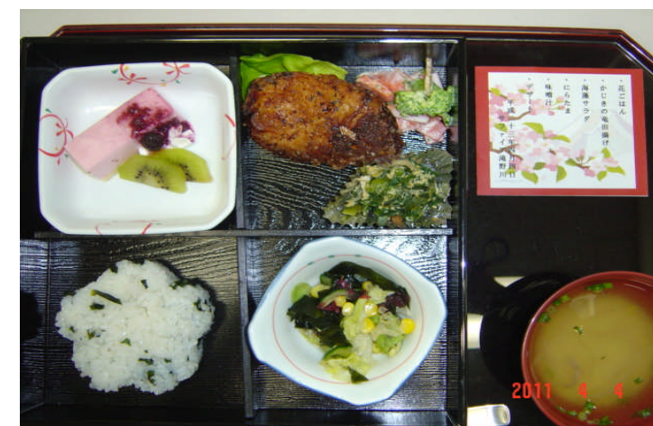
ある日のイベントメニュー(昼食)

当日は栄養科より春をイメージしたイベントメニューが提供されました。鮮やかに彩られたお食事が、ご利用者の方々にとても喜ばれていました。