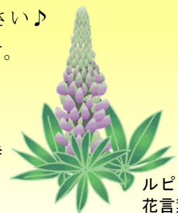
ルピナスとはのぼり藤のこと 花言葉は「多くの仲間」です